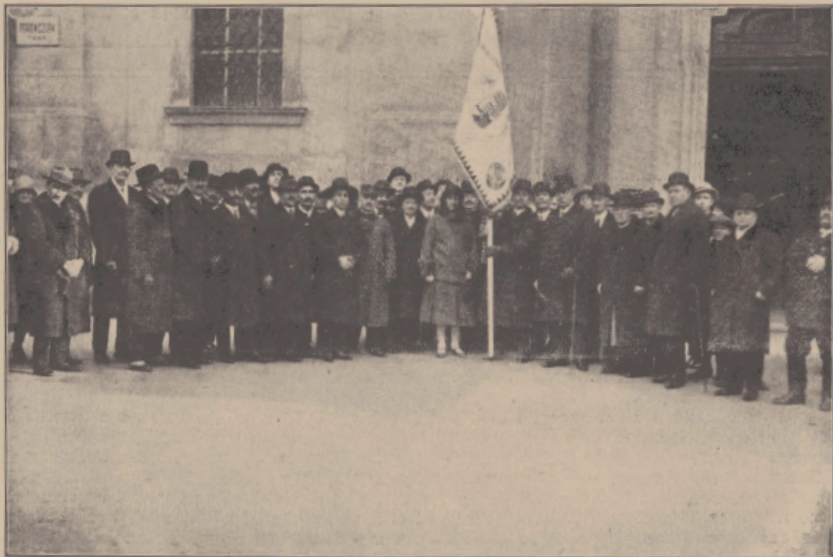
Az Országos Magyar Méhészeti Egyesület 50-éves ünnepe.

Hanem a megindítás fárasztó munkáját nem azért emelte a vállára ama négy vezetőférfiú, hogy az első csalódás után csüggedten lankassza el nekifeszülő akarását. Nem: mert a munka szeretése acélozta őket és a cél vezette nekilendülésüket azokban a történelmi időkben.