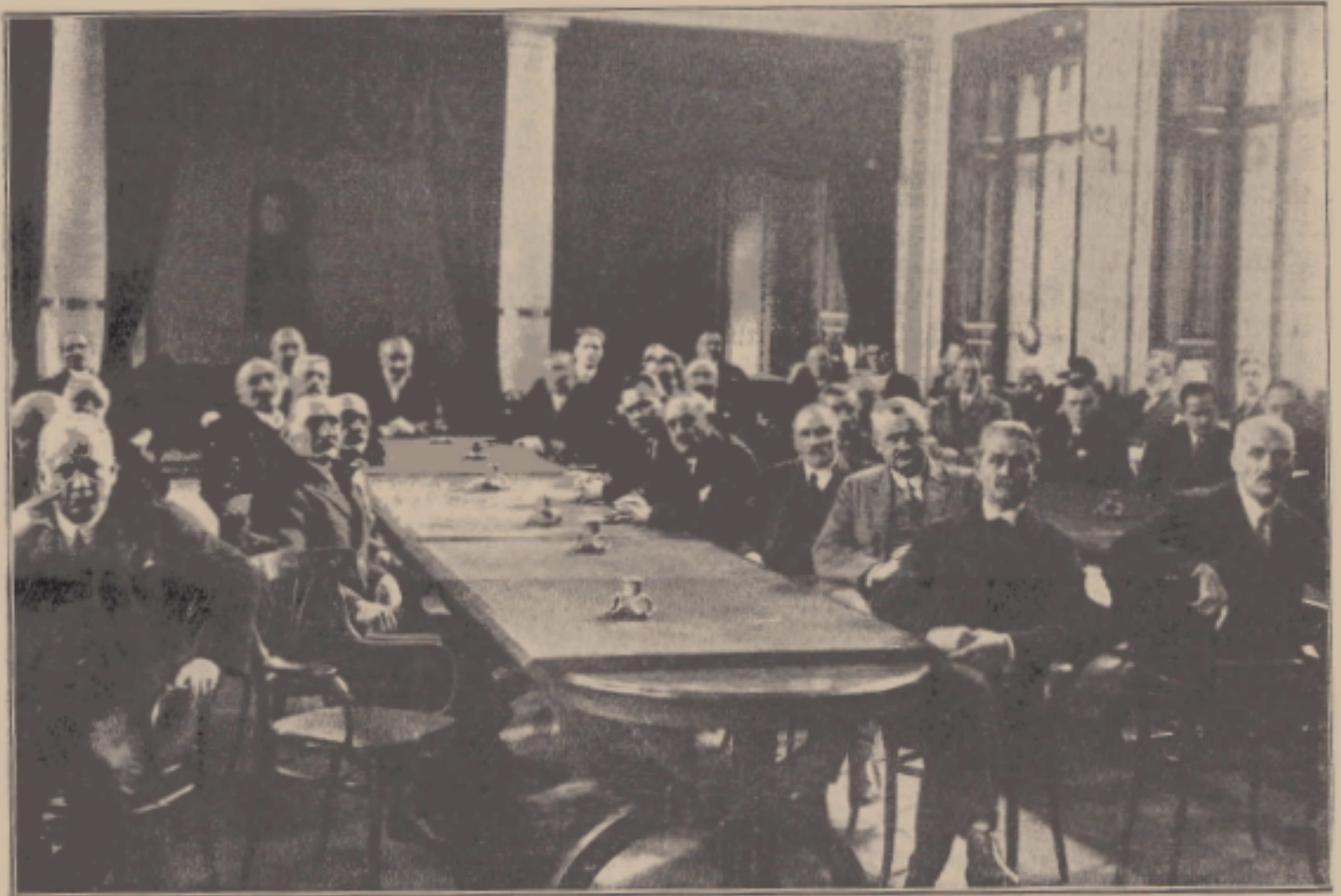
Az Országos Magyar Méhészeti Egyesület 50-éves ünnepe. A disztágyülés résztvevőinek egy része az OMGE. dísztermében.

fölötte nehéz feladatot úgy elvégezni, ahogy azt elvégezte, de ugyanakkor már elő is soroltam azokat a legfőbb érdemeket, amelyekért a magyar méhésztársadalom törhetetlen ragaszkodása és hálája Szilassy elnök urat még a síron túl is kísérsni fogja. Mi, akik a magyar méhésztársadalom mozgalmában az utolsó évtizedekben résztvettünk, tudjuk, hogy 25 év előtt ez az egyesület csak nagyon szerény s talán nem is éppen a legörvendetesebb életjeleket adta magáról. Ebben a válságos órában, az egyesületnek ebben az élet-halál harcában jelenik meg a hivatott vezér, kirántja az egyesület sárba rekedt szekereit, menetének új irányt jelöl ki és azóta megszakítás nélkül viszi a szekér utasait, a magyar méhésztársadalmat ama birodalom felé, amelyet boldogulásnak hívnak. 25 év! Milyen szép idő egy ember életében! És Te, szeretett elnökünk, ennyi idő óta gondozod a magyar méhészet állandó sorscsapásokkal dacoló fáját. Pedig ez a fa nem Neked, csupán a Te nagy családnak, a magyar méhésztársadalomnak termi a gyümölcsét. Ne vedd rossz néven szeretett Vezér, hogyha mi ma is, még ez ünnep alkalmából is csak kéréssel tudunk Hozzád fordulni. Arra kérünk, hogyha mi e 25 év alatt talán itt-ott megfedekezünk volna